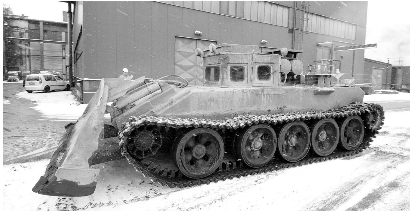
TANKY DOSLOUŽILY. Tanky, které po desetiletí odstraňovaly rozžhavenou strusku, končí. Nahradí je buldozery.

Vyřazené a upravené tanky se používaly k odstraňování rozžhavené strusky pod tandemovými pecemi, jiné stroje dosud v těžkém provozu neobstály